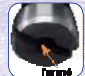
Graissage pompe à vide sur culasse