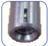
Clafetage 1/2 lune

Attention montage Renault après 95 voir particularités sur photo