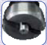
Graissage pompe à vide par arbre à cames

Peugeot pompe à vide en bout d'arbre à cames ou par courroie